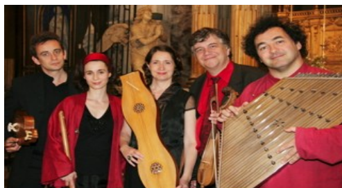
(Extraits de la page d'accueil du site internet d'Obsidienne)

Obsidienne a participé à de prestigieuses programmations en France : Festival d'Ile de France, Ambronay, Le Thoronet, Semaines musicales de Quimper, Amphithéâtre de l'Opéra de Lyon, Cité de la musique, et se produit régulièrement à Radio France, ainsi qu' à l'étranger : Italie (le Chant des Pierres, Radio Piémontaise), Espagne (Festival de Musique Ancienne de Barcelone), Portugal (Fondation Gulbenkian), Allemagne (Lörrach, Potsdam), Angleterre (Newcastle), Suisse (Festival de musique improvisée de Lausanne, Abbaye de Bonmont, Radio Suisse Romande), Belgique (Festival des Flandres, Festival des Midis – Minimes, Festival de Wallonie). Sa discographie chez Calliope et OPUS 111 a obtenu les plus prestigieuses distinctions de la presse française et internationale (Grand Prix du Disque, Diapason d'or, Choc du Monde de la Musique, 10 de Répertoire, 5 étoiles Goldberg, Recommandé par Classica, Bravo de Tradmagazine...).